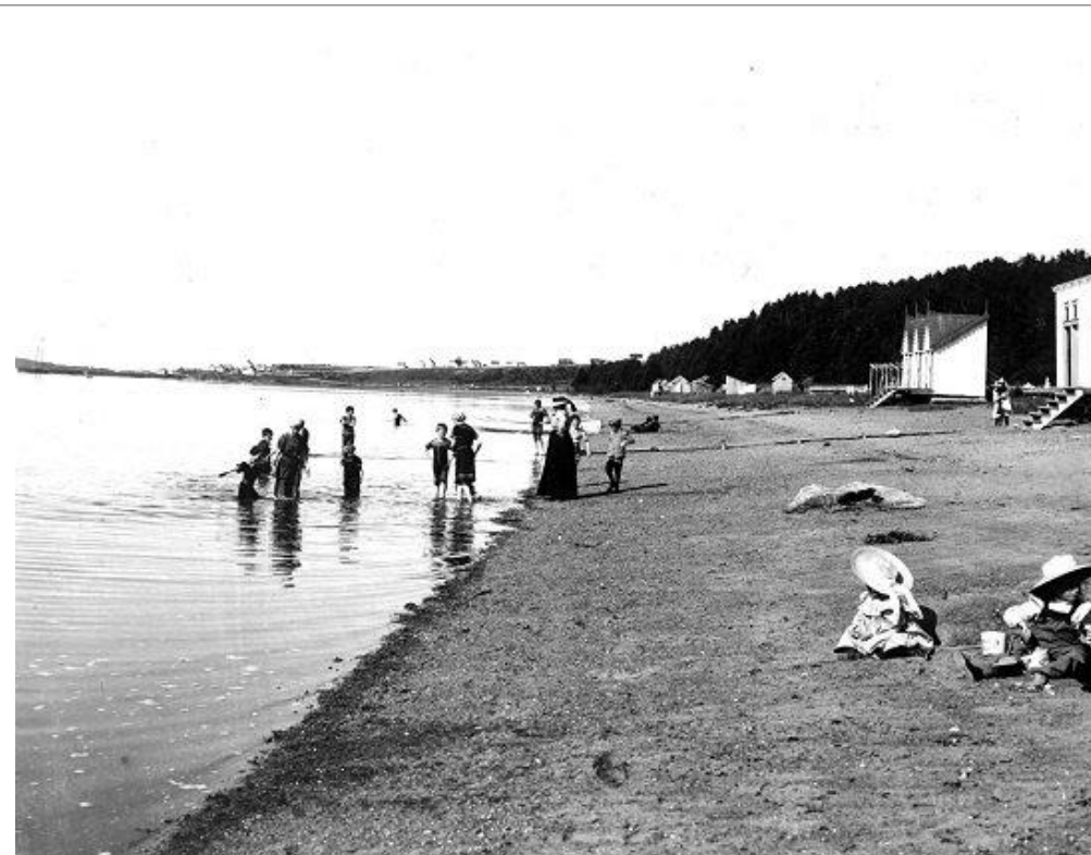
La grève de Cacouna, vers 1900.

L'équipe de la direction du Bas-Saint-Laurent et de la Gaspésie—Îles-de-la-Madeleine vous souhaite un magnifique été.